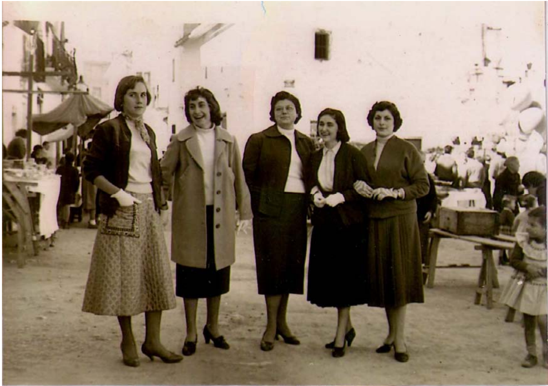
Imatges de la plaça als anys 70. Dalt un grup d'amigues junt a les parades del porrat. A la fotografia inferior es pot observar com al fons, per darrere de les parades, se situen els cotxes de xoc. És evident que estan introduint-se atraccions de fira electrificades i més modernes, substituint a les atraccions mecàniques antigues.