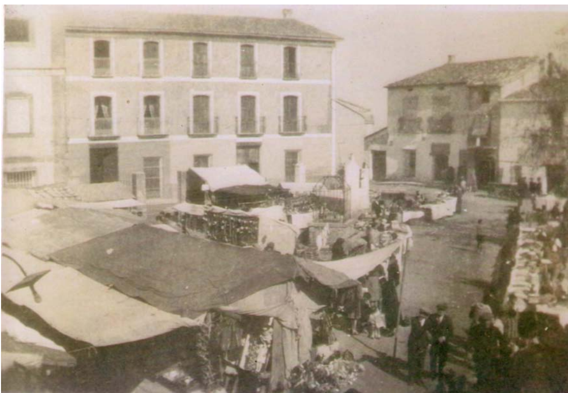
Singular imatge de la plaça Major, amb les tradicionals parades del porrat, és aproximadament l'any 1915.

A mode de suggeriment, seria molt convenient intentar buscar l'equilibri en la definició dels espais del porrat, de tal manera que els llocs on històricament s'han instal·lat les parades tradicionals recuperaren el cap de setmana del porrat eixe aspecte i sabor d'altres temps, tant el carrer major com a la plaça deuria de quedar restringit com un espai on es recrearia el porrat més tradicional, sense aparells de fira contemporanis, que deurien d'anar al recinte firal.